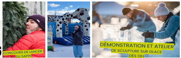
CONCOURS DE LANCER DU SAPIN