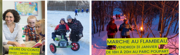
HEURE DU CONTE 13H30 - 14H30 - 15H30

CARNAVAL SAMEDI 1ER FÉVRIER DE 11H À 16H, AU PARC DES LOISIRS PLAISIRS PLEIN AIR